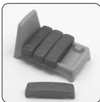
Lit avec Coussins d'Amour

Attention ! Le dernier « célibataire » à se présenter au Love Hotel, choisit parmi les cartes restantes une ou un partenaire avant d'entrer dans l'hôtel.