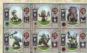
Recto : jeu de base