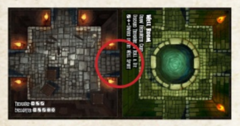
Exemple de placement de tuiles incorrect

Il existe 2 types de tuiles donjon : standards (grises) et spéciales (vertes). Les tuiles spéciales possèdent des règles uniques qui leur sont propres.