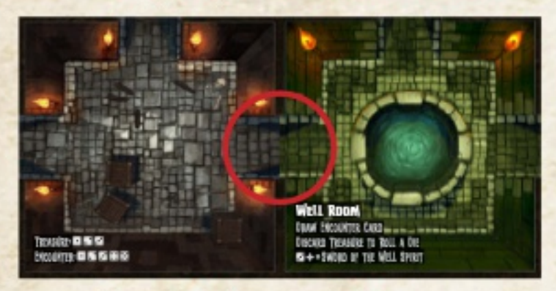
Exemple de placement de tuiles correct

Une tuile donjon ne peut pas être placée de telle manière à ce qu'une sortie soit bloquée (voir exemple ci-dessus). Si une tuile ne peut pas être tournée de façon à ce que toutes les sorties soient connectées à d'autres sorties ou à un espace vide, celle-ci est défaussée et une nouvelle tuile doit être piochée à la place. Si aucune tuile ne peut être placée au