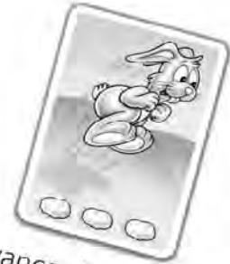
Avance de 3 cases