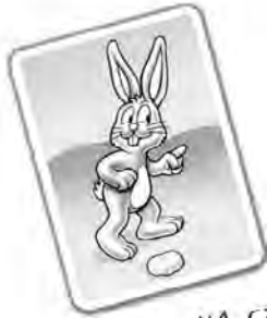
Avance d'1 case

Lorsque tu retournes une carte représentant un lapin, avance l'un de tes lapins vers le sommet du nombre de cases indiqué.