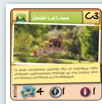
Main de Franck