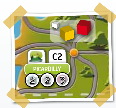
Des joueurs ont dévoilé une carte Sport (cube jaune) et une carte Gastronomie (cube rouge) qui se situent toutes deux à Picardilly, en C2.

1 point souvenir + autant de points souvenirs qu'il lui manque de points curiosité pour rallier au plus court l'arrivée (veillez à compter les points de curiosité de pénalité lors des passages dans des localités sans visite s'il y a lieu !)