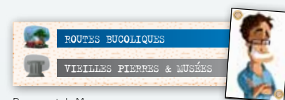
Passeport de Marc