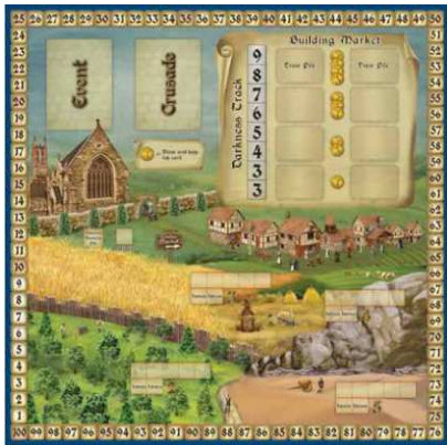
1 plateau principal