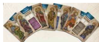
7 cartes Saint Patron