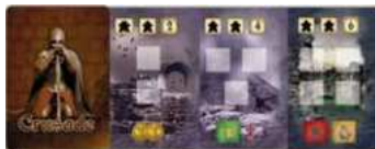
28 cartes Croisade (21 sans Sainte Relique et 7 avec)