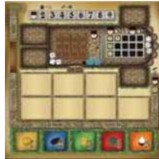
1 plateau individuel