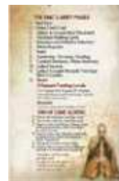
1 carte Aide de Jeu