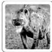
La hyène ricane.