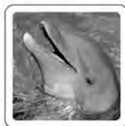
Le dauphin couine.

Et le vainqueur de la partie crie « Youpi ! »