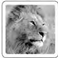
Le lion rugit.