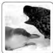
Le phoque bêle.