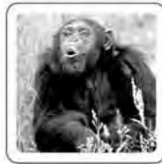
Le singe crie.