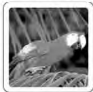
Le perroquet jase.