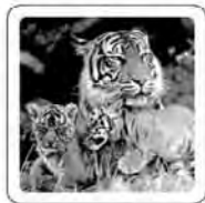
Le tigre feule.