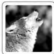
Le loup hurle.