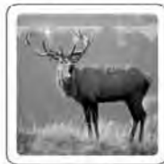
Le cerf brame.