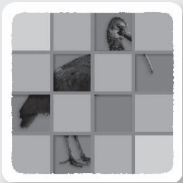
les cartes Mission