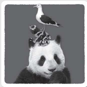
les cartes Mission Solo