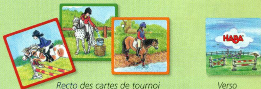
Recto des cartes de tournoi

24 cartes de poney (6 cartes par poney), 12 cartes de tournoi, 4 carottes, 1 règle du jeu