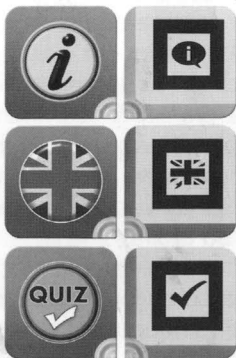
Fig . 4